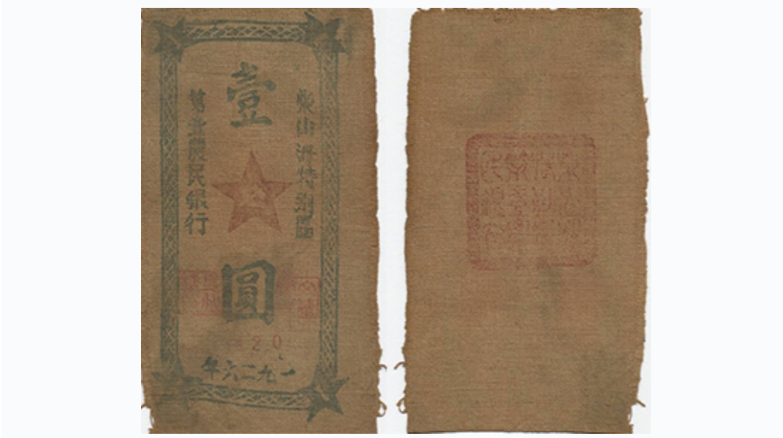
柴山洲特别区第一农民银行壹元布币