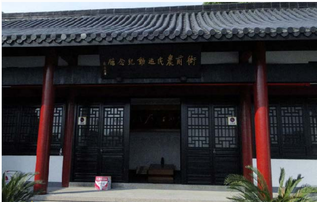
浙江萧山衙前农民运动纪念馆

在创立时期，中国共产党人就认识到农民在中国革命中的重要地位和作用。1921年9月，在中国共产党的组织领导下，浙江萧山县衙前村成立农民协会，发表《衙前农民协会宣言》和《衙前农民协会章程》，影响波及萧山、绍兴、上虞3县82村的10多万农民，掀起了轰轰烈烈的减租斗争。1924年12月，衙前农民协会创办了萧山衙前信用合作社，是农民协会第一个合作金融机构。