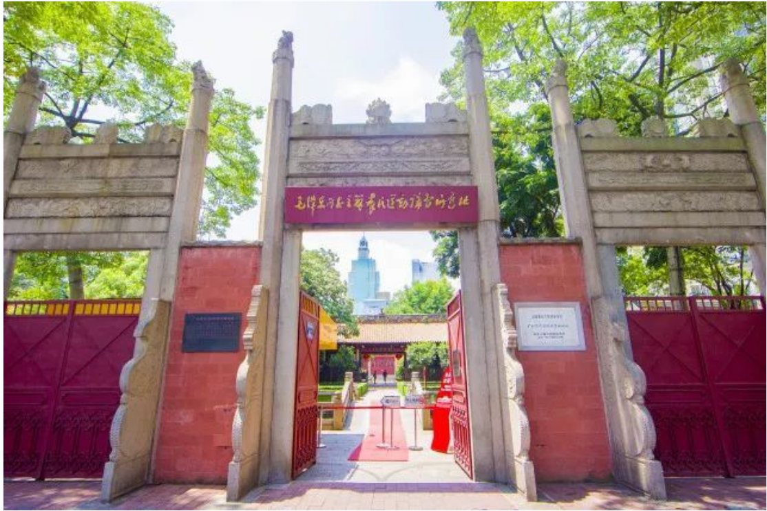
广州农民运动讲习所旧址

1924年7月，第一届广州农民运动讲习所开学，到1926年9月，农民运动讲习所先后举办了六届。农讲所培训了700多名农运骨干，有力地促进了全国农民运动的发展。