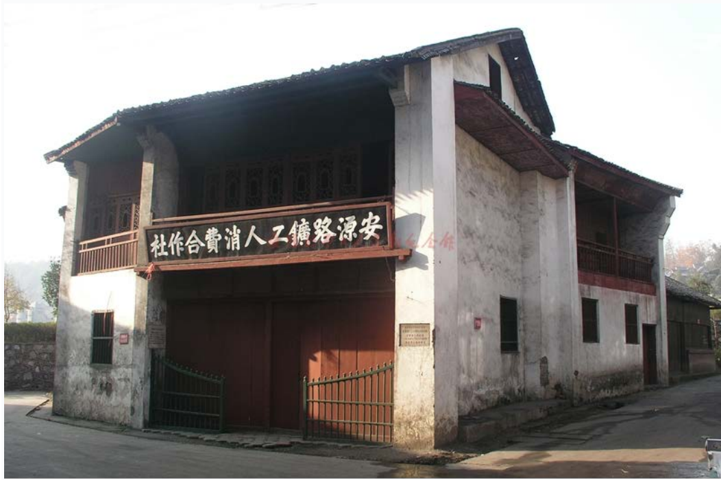
安源路矿工人消费合作社旧址