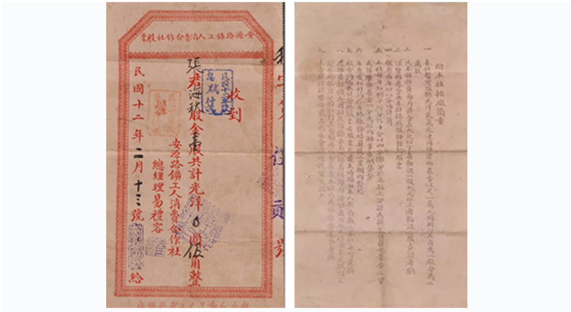
安源路矿工人消费合作社发行了中国共产党领导创办的经济实体最早的股票