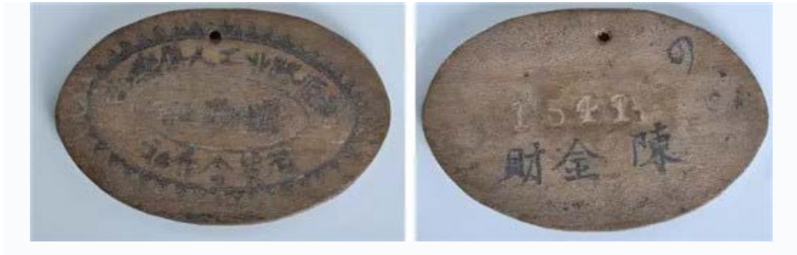
安源路矿工人消费合作社购物证

合作社主要售卖大米、布匹、油盐等生活必需品，这些货物大多从长沙、株洲等地采购，由工人顺便捎回，因而免去了运费，所以货物价格比市场上便宜很多。凡是安源路矿工人俱乐部的部员，可凭合作社发给的购物证到合作社购买低价物品，否则按市场价购买，以防止中间商和工头倒卖，赚取中间差价，扰乱市场。